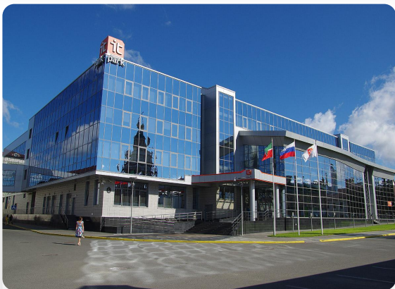
ИТ-парк Казань открыт в 2009 г.