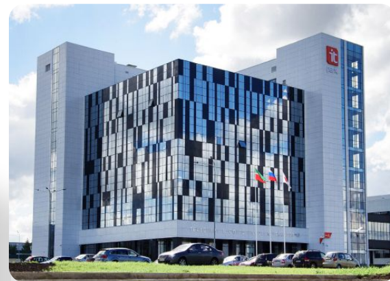
ИТ-парк Набережные Челны открыт в 2012 г.