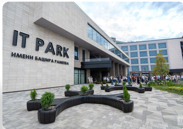
ИТ-парк им. Башира Рамеева открыт в 2022 г.