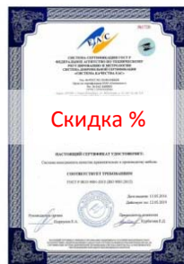
Сертификат ИСО 9001

» Пакетные предложения » Пакетные предложения по ИСО » Пакет «Премиум» по ИСО