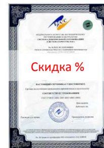
Сертификат ИСО 14000/18000