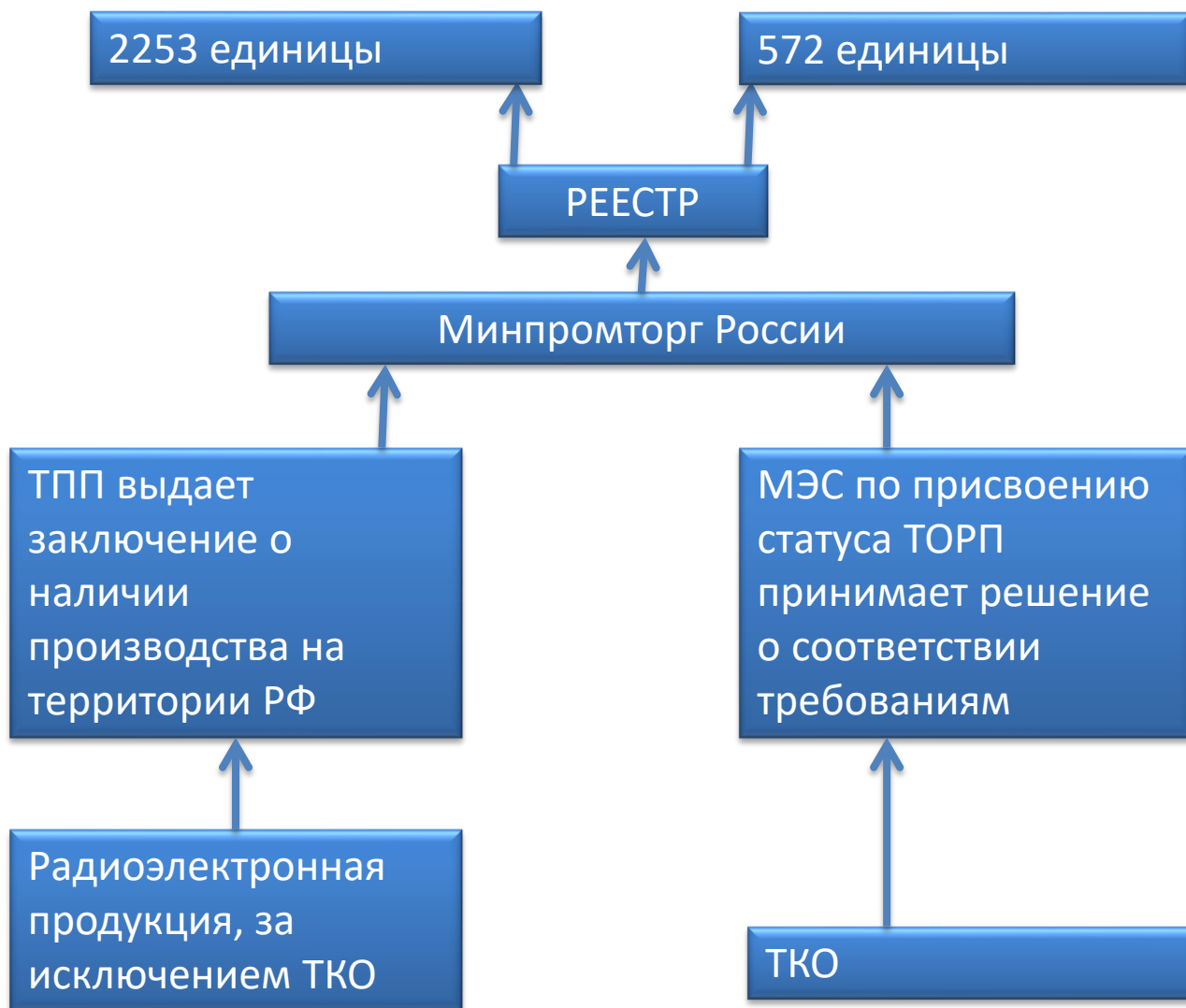
Схема формирования Единого реестра российской радиоэлектронной продукции